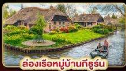
ล่องเรือหมู่บ้านทีรูร์น