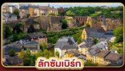
ลักซิมเบิร์ก

ที่สุดของธรรมชาติ แห่ง “ยุโรป” สวนดอกไม้ KEUKENHOF 1ปีมีครั้งเดียว