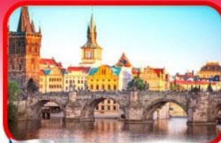
เขื่อนอินสพานชาร์ลส์