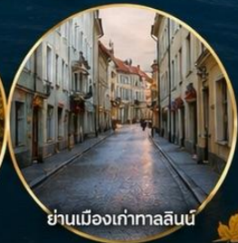
ย่านเมืองเก่าทาลลินน์