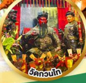
วัดกวนโก ขอพรเทพเจ้ากวนอู เงินทอง, ธุรกิจมั่นคง