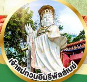
เจ้าแม่กวนอิมพรพิสัย ขอพรรับพลังงานดี เสริมพลังดวงจัญ