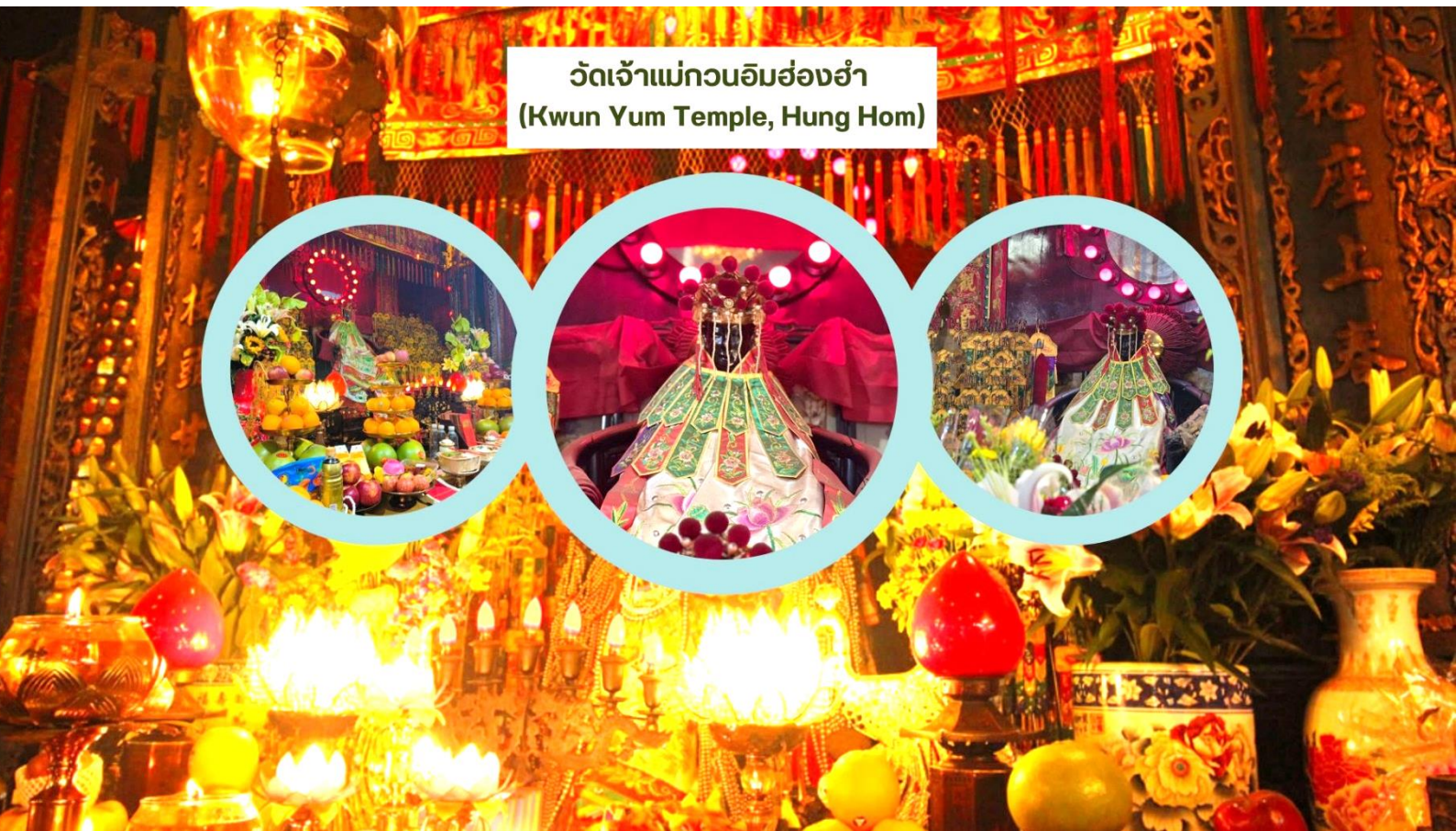
วัดเจ้าแม่กวนอิมฮ่องกง (Kwun Yum Temple, Hung Hom)

3. ให้เดินวนตามเข็มนาฬิกาอบเทพเจ้าไฉ่ซิงเอี้ยะทั้ง 5 องค์ จนครบ 3 รอบ ขณะที่เดินผ่านแต่ละองค์ให้ขอพร และไหว้ 3 ครั้ง เมื่อเดินจนครบให้กลับมายืนที่องค์ตรงกลาง บอกชื่อ-นามสกุล วัน/เดือน/ปี ที่มาไหว้ท่าน ตั้งจิตอธิษฐานขอพรมองไปที่ใบหน้าของท่าน