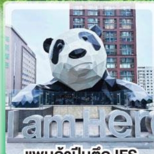
แพนด้าป็นตึก IFS