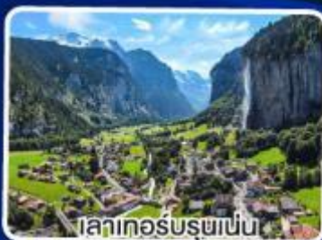
ฟยอร์ดบรูนาเงิน