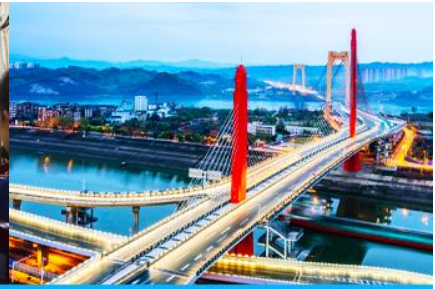
เมืองหยิซาง

วันที่ห้า เมืองจางเจี๋ยเจี๋ย- เลือกซื้อโปรแกรมทัวร์เสริม OPTIONAL TOUR - ร้านหยก-ร้านใบชา-เมืองหยิซาง