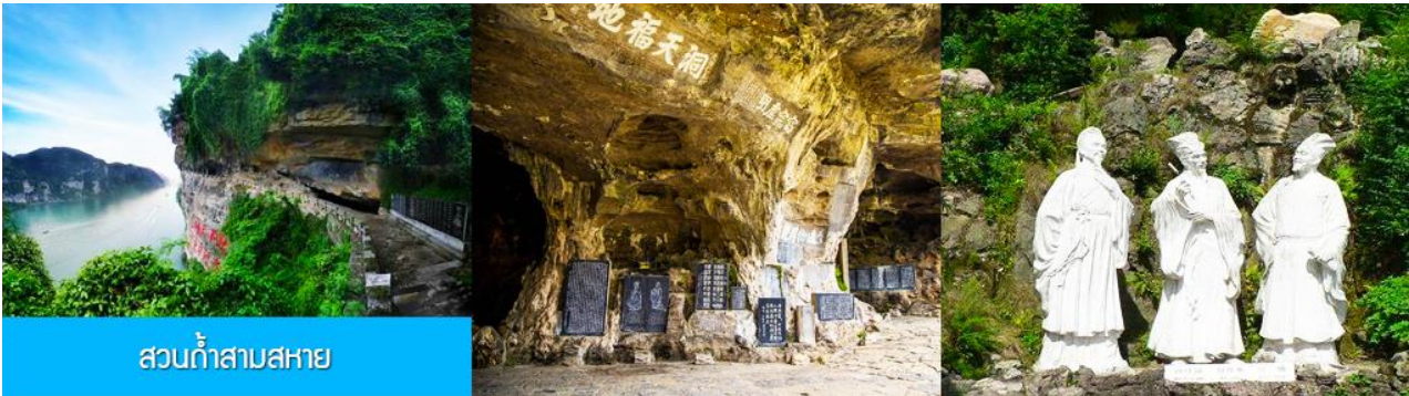
สวนกำสาบสหาย