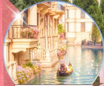
เวนิส เมืองต้าเหลียน