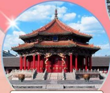
พระราชวังกู้กง เส้นหยาง

02-09 กันยายน 2569 07-12 กันยายน 2569 14-19 กันยายน 2569