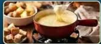
ลิ้มลองเมนูฟองดูร์ สโตล์สวิส