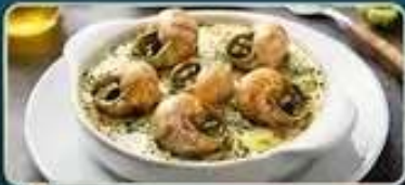
ลิ้มลองเมนูหอยเอสคาโก้