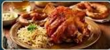
อิมอร่อยเมบูฆาหมูเยอรมัน