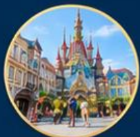
ถนนยุโรป European Streetmosphere