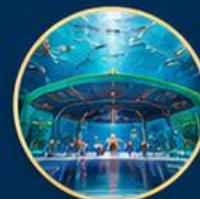
โลกใต้ท้องทะเล The Sea Shell