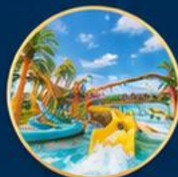
สวนน้ำไต้ฝุ่น Typhoon World