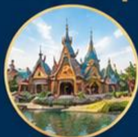
หมู่บ้านไวกิ้ง Mysterious Viking Village