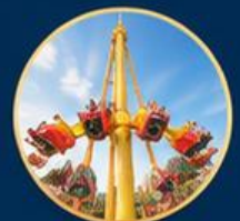
โลกการผจญภัย Adventure World