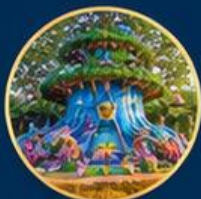
โลกแฟนตาซี Fantasy World