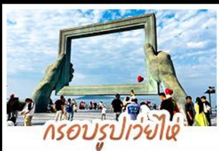
กรอบรูปเว่ยไห่

ทำอรุณยามเมืองท่าสไตลียอร์มัน • โบสถ์ซันติไมเคิล และย่านป่าด้ากวน พร้อมทัวร์พิพิธภัณฑ์โรงเบียร์ชิงเต่าระดับตำนาน ฟรี! ซิมเบียร์สดท่านละ 1 แก้ว เช็คอินแมนมหาสมบัติมีเบเกอรี่ขนมเค้กพิซซ่า 8 • แวะทำอรุณสุดฮอตกับ ซากเรือลู่ฉาง • ตกค่ำตะลุยของกินที่ตลาดสไตลียอร์มัน ถนนอันเลื่องชื่ เที่ยวอิสระ-ตามใจชอบ จัดสรรเวลาให้ท่านด้วยวัน FREE DAY 1 วันเต็มในชิงเต่า