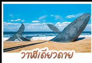
วาฬยัดขวดดาช