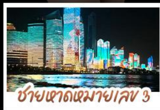
ซำเซาตเตมาเขาเลข 3