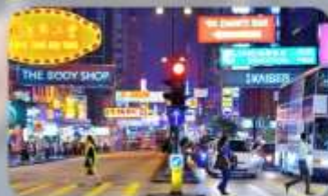
จิมซาจู้