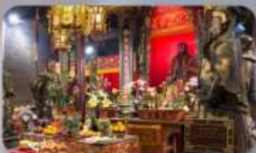
วัดบิกโก

THE LUXE MANOR HOTEL หรือเทียบเท่า 4-5 ดาว