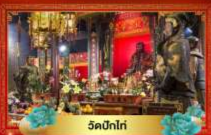
วัดปึกโท่

24,999.- ราคาเพียง เดินทาง : 03-05 มี.ค. 70