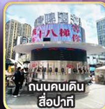
ถนนคนเดิน สี่ปาตี