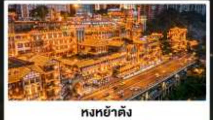
หงหย่าตั้ง