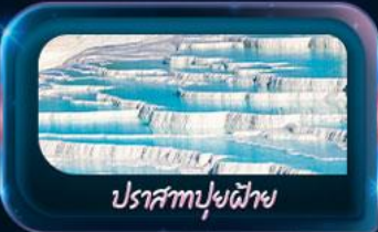
ปราสาทฟูฝ้าย