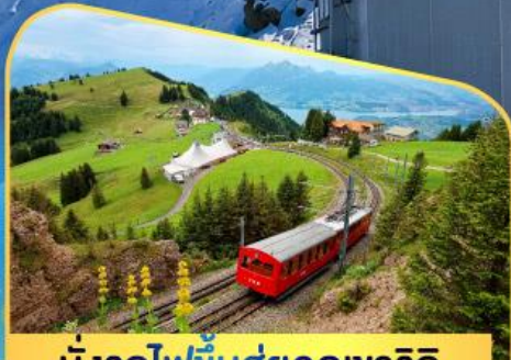
นั่งรถไฟขึ้นสู่ยอดเขาโรติก