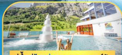
แช่น้ำแร่ร้อนผ่อนคลายลดยาคอร์บิด