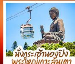
นั่งกระเช้าของปิง พระใหญ่เกาะคัมตา