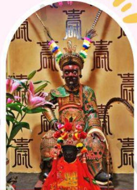
วัดเซ่งจ้งเก้งเก่าแก่ 400 ปี ไซกง