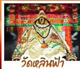
วัดฉีฉินฟ้า