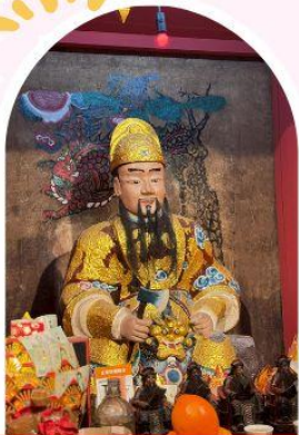
วัดเซ่งจ้งเก้งเก่าแก่ 600 ปี หยุนหลง

"ไหว้พระ เสริมดวง เพิ่มสิริมงคลแก่ชีวิต"