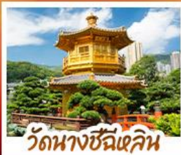
วัดนางชีฉีฉิน