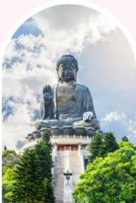
นั่งกระเชานองปิง นมัสการพระใหญ่โป้วหลิน