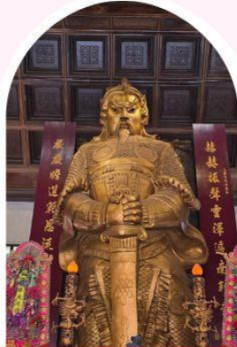
วัดเซ่งจ้ง ซาถึน ขอพรโชคลาก การเงิน และธุรกิจ