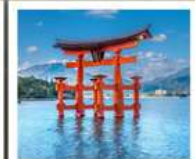
ศาลเจ้าอิตสึคุชิมะ