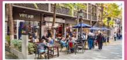
ช้อปปิ้ง