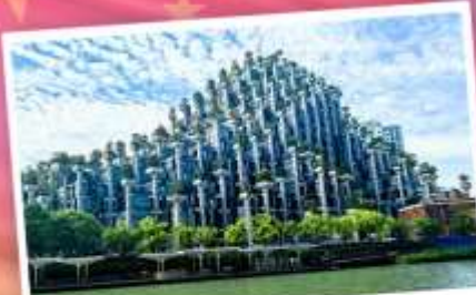
ต้นไม้พันต้น