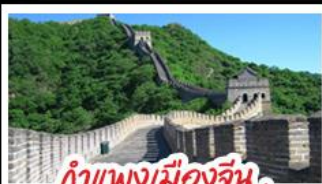
กำแพงเมืองจีน ด้านมู่เทียนยวี่

Universal Beijing - กำแพงเมืองจีนด้านมู่เทียนยวี่ (รวมกระเช้าขึ้น-ลง) พระราชวังโบราณกู้กง - หอฟ้าเทียนถาน - ซุปป์ิงถนนหวิงฟูจิ่ง และซานหลู่กุน เมนูพิเศษ สุกุมองโก, เบ็ดปักกิ่ง, Michelin Guide ร้าน Tao Tao Ju