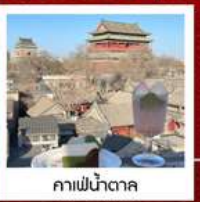
คาเฟ่ น้ำตาล