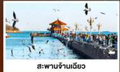
สะพานจ้านเฉียว