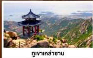
ภูเขาเหล้าซาน