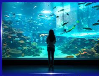
อควาเรียมยักษ์รูปเต่า