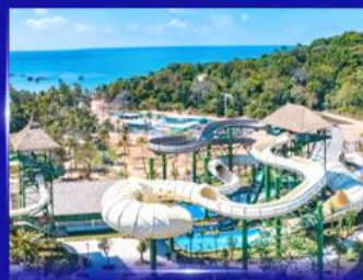
สวนสนุก Sun world Hon thom