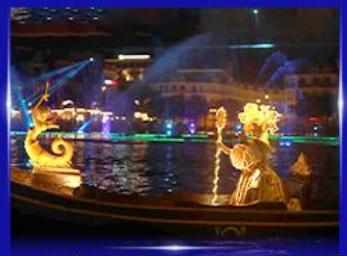
ชมโชว์เวนิสจำลอง แกรนด์เวิลด์