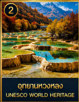
2 อุทยานหวงหลง UNESCO WORLD HERITAGE