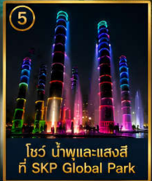
5 โชว์ น้ำพุและแสงสี ที่ SKP Global Park