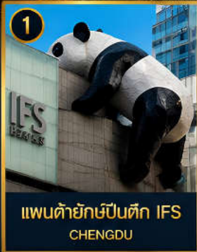
1 แพนด้ายักษ์ป็นตึก IFS CHENGDU