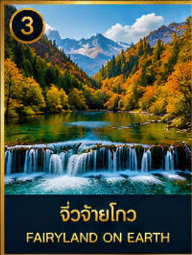
3 จิวจ้ายโกว FAIRYLAND ON EARTH