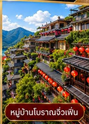
หมู่บ้านโบราณฉิวเฟิน