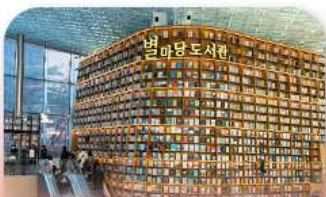
ห้องสมุดสตาร์ฟิล