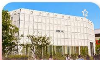
บูรักลินเกาหลี่