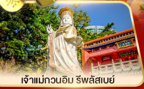
เจ้าแม่กวนอิม ธิพลสมัย