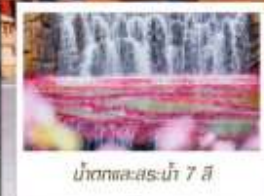
น้ำตกและสระน้ำ 7 สี

🗋️ โหลด 23 KG. x1 ทิ้งไป - กลับ ✓ ฟรีมัสมักร ✓ ไม่เข้าร้านรัฐบาล ✓ ทิวทัศน์เล็ก ✓ รวมค่าเข้าชมสถานที่ตามโปรแกรม