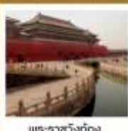
พระราชวังกรุงปักกิ่ง