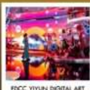
EDCC YIYUN DIGITAL ART