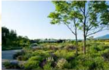
TOKACHI MILLENNIUM FOREST