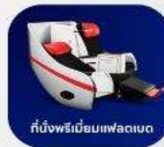
ที่นั่งพรีเมียมแพลนเน็ต