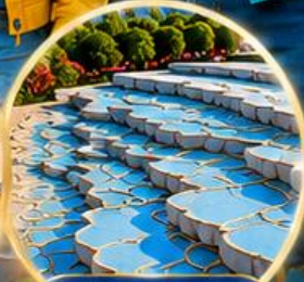
ปามุกคาล์ Pamukkale