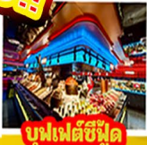
บูฟเฟต์ซีฟู้ด