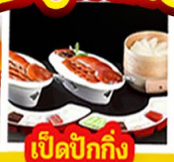
เปิดปีกัง