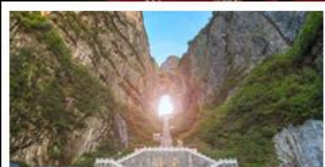
เขาประตูลั่วจื่อ