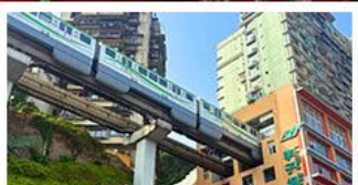
รถไฟทะลุคด