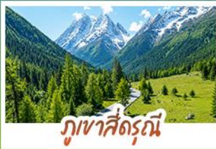
ภูเขาสี่ตรุณี