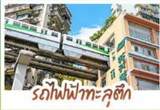
รถไฟฟ้าทะเลติ๊ก

ชมธรรมชาติ ณ อุ้หลง ชมหุบเขาสุดอลังการระดับมรดกโลก นั่งรถไฟฟ้าทะเลติ๊กหลี่จ้อป้า สัญลักษณ์เมืองฉงชิ่งสุดล้ำ สัมผัสวิถีภูเขาหิมะแห่ง ภูเขาสี่ตรุณี งดงามจนได้รับฉายา "เทือกเขาแอลป์แห่งตะวันออก" ชมธรรมชาติสุดฟิน ณ อุทยานปี่ฝิงโกว • ช้อปปีงจุใจ ถนนคนเดินไท่กู่หลี่, ถนนคนเดินซุนซู่