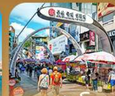
ตลาดนัมโพดง