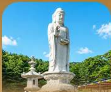
วัดดงซาซา

เปิดประสบการณ์เที่ยวเกาหลีสุดคุ้ม บินครั้งเดียว เที่ยวสองเมือง • เช็กอินถนนนักร้องคิมควังซอก สัมผัสเสน่ห์ศิลปะและเสียงเพลง • นั่งรถไฟปิ๊กทอมวีกะเลปูซาบ • หมู่บ้านคิมซอนสีสดใสใ ก่อนเยือนวัดแฮดงยงกุงซาและวัดคยองซาซา เสริมความเป็นสิริมงคล • เวชชะมทำเรือสิริ่ง Bunezia ปิดท้ายด้วยช้อปปิ้งเอาท์เล็ทแดนคัมมาร์เก็ตช็อดัง พร้อมเดินช้อปปิ้ง Walking Street สุดฟิว