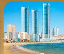
หาดแซอินแด