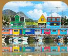
ท่าเรือจั้งนึม