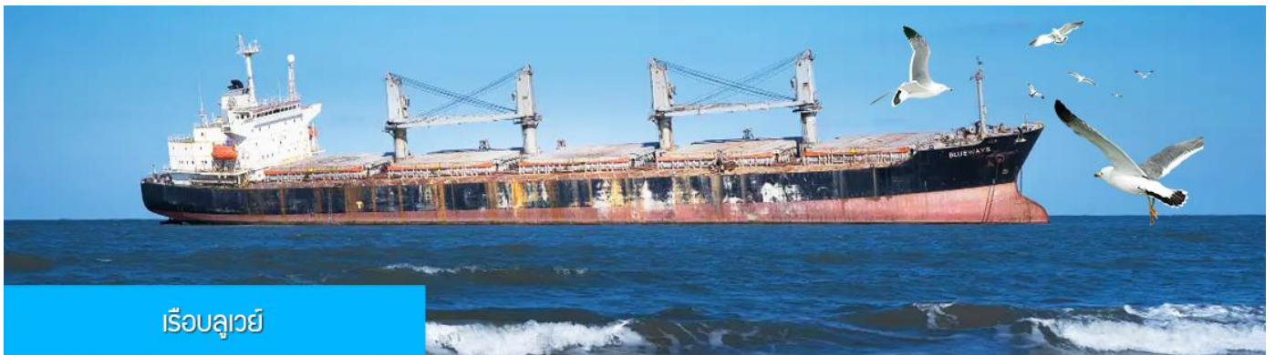
เรือลู่หยี่

นำท่านชมและถ่ายภาพคู่กับ กรอบรูปยักษ์วิวทะเล 威海公园大相框 แลนด์มาร์คที่เป็นอีกหนึ่งไฮไลท์ฮิตของเมืองเวย์ไห่