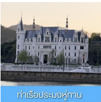
ท่าเรือประมงหู่กาน

พักที่ DALIAN JUZISHUIJING HOTEL / SANSHUI HOTEL โรงแรมระดับ 4 ดาวท้องถิ่น ต้าเหลียน