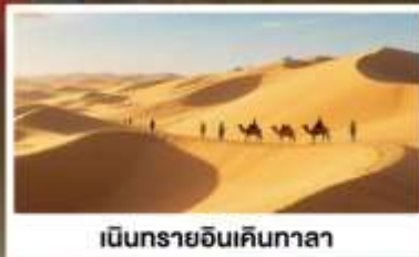
เป็นกรายอินเคินกาลา