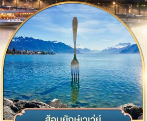
ล้อมยีก่เว่วย