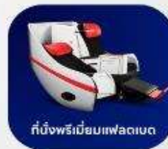
ที่นั่งพรีเมียมแพลนเน็ต