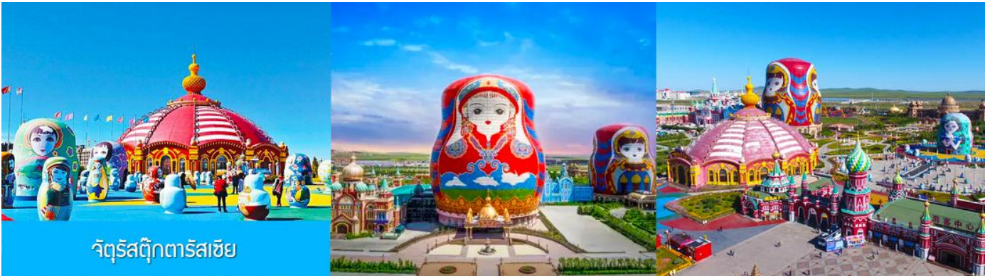
จัตุรัสตุ๊กตารัสเซีย