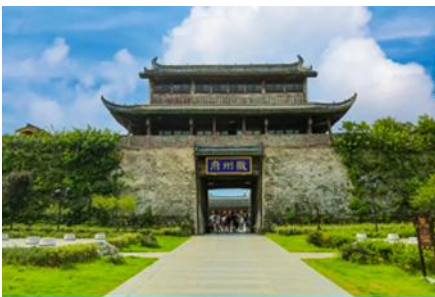
เมืองโบราณฮุยโจว

เช้า รับประทานอาหารเช้า ณ ห้องอาหารของโรงแรม (1)