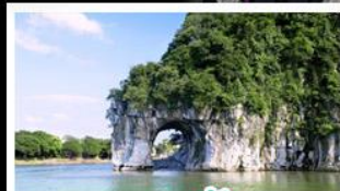
เขางวงช้าง