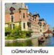
เวนิสแห่งต้าเหลียน