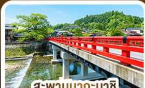
สะพานนากะบาชิ ทาคายาม่า