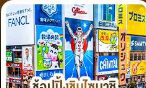
ช้อปปิ้งชินโซบาชิ และโดตงโมริ