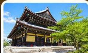
วัดนันเซ็นจิ