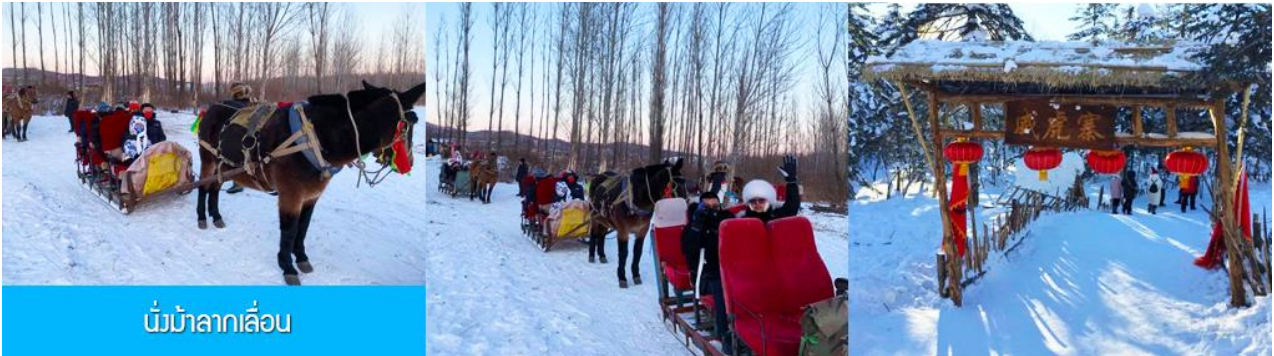
นั่งม้าลากเลื่อน