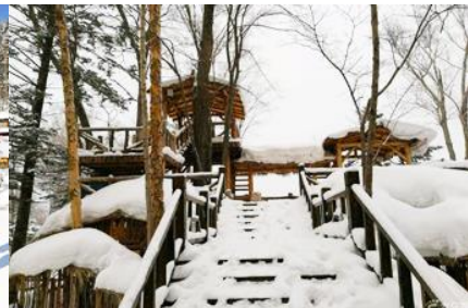
ระเบียงชมวิวปี้วูยซาน

วันที่สาม เมืองฮาร์บิน-สถานีรถไฟยาบูลี-รวมนั่งม้าลากเลื่อน- หมู่บ้านหิมะ Xue xiang China Snow Town - ระเบียงชมวิว เขาปี้วูยซาน- ชมแสงสียามราตรีหมู่บ้านหิมะ-ชมพลุไฟและขบวนพาเหรดระบำพื้นเมือง-นอนในหมู่บ้านหิมะ Xue xiang