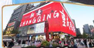
ถนนคนเดินถวณอันเฉียว