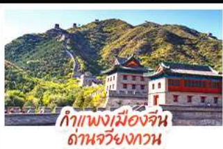
กำแพงเมืองจีน ด่านจวิ๋นกวาน

ล่องเรือสุดโรแมนติกแม่น้ำหวงผู้ ปักกิ่ง...เปิดประตูสู่แดนมังกร ด้วยความอลังการระดับจักรพรรดิ ชิงเต่า...เมืองชายทะเลสไตล์ยุโรป หอระฆังแบบพอนคลาย เซี่ยงไฮ้...มหานครแห่งเอเชีย เมืองที่ไม่เคยหลับใหล