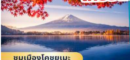
ชมเมืองโคชูยูเมะ