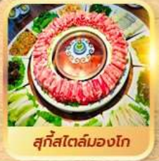
สุกีสไตล์มองโก